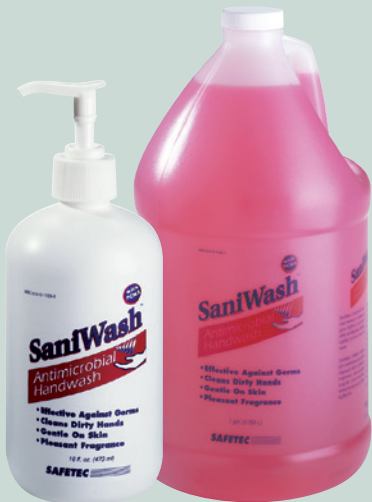
No. AH16 y AH128