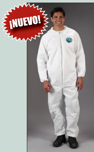
Overoles Lakeland MicroMax NS con elástico en muñecas y tobillos.