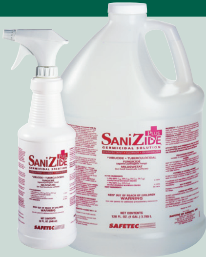
No. DC32 y DC128