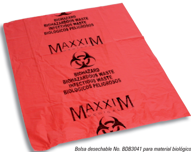
Bolsa desechable No. BDB3041 para material biológico peligroso