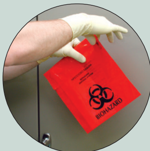
Pliegue la solapa adhesiva, selle y deseche la bolsa adecuadamente.