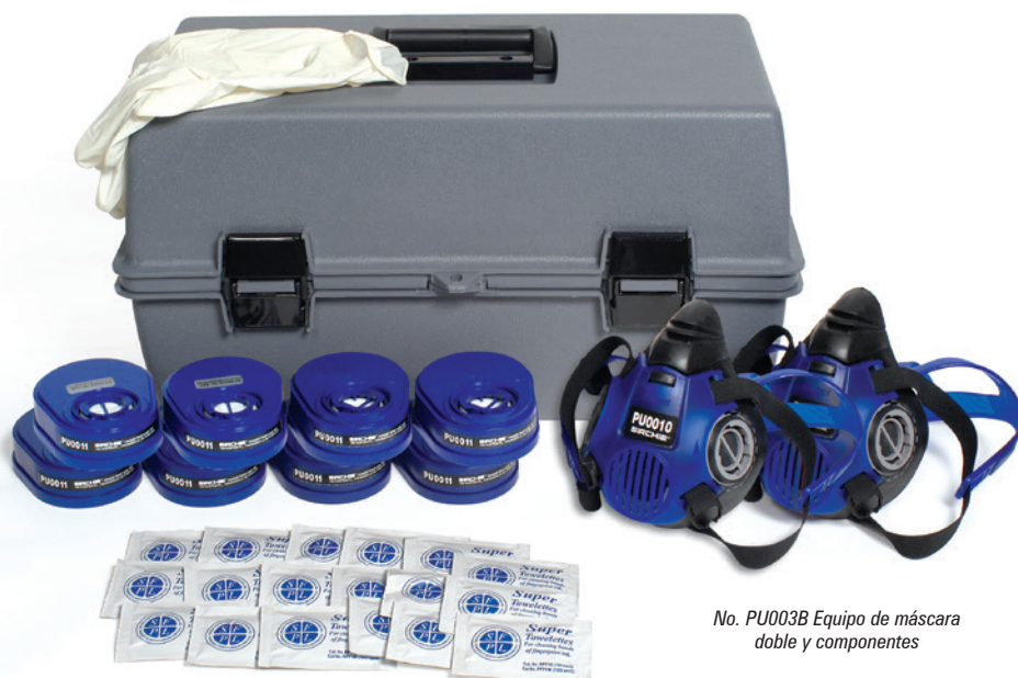
No. PU003B Equipo de máscara doble y componentes