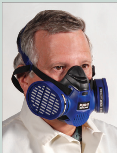
No. PU0010 con filtros PU0011

¡Máscara multiuso con 3 opciones de filtro!