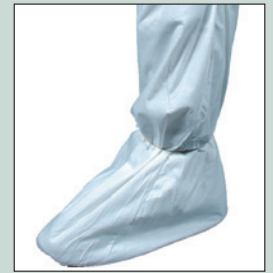
Botas protectoras altas descartables No. TYV200.