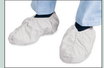
Fundas para zapatos descartables No. SF0073.