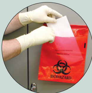
Inserte el residuo biológico peligroso.