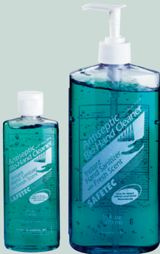
No. ABC4 y ABC16