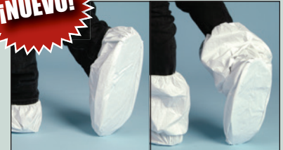
Fundas para zapatos Micro- Fundas para botas MicroMax NS No. SC100LXL Max NS No. BC17LXL