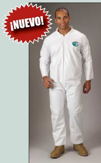
Overoles Lakeland MicroMax NS.