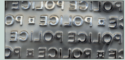
No. SF0075 (Acercamiento de suela con relieve).