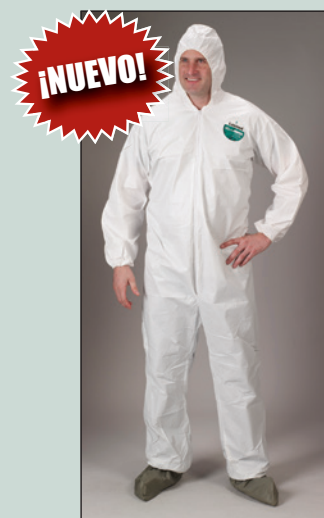
Overoles Lakeland MicroMax NS con capucha y elástico en muñecas y tobillos.