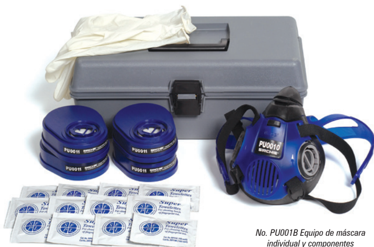
No. PU001B Equipo de máscara individual y componentes

Estas máscaras reutilizables de poca manutención pesan menos de 1/4 kg (1/2 lb) y se adaptan a cualquier tamaño de cabeza. El filtrado se logra mediante un filtro tratado químicamente aprobado por NIOSH/MSHA para usar con vapores orgánicos, cloro, cloruro de hidrógeno, dióxido de cloro y dióxido de azufre. Su sencillo sistema de suspensión deslizante las convierte en máscaras fáciles de usar. Todas las máscaras están aprobadas por NIOSH/MSHA. Se recomienda usar una máscara por persona para eliminar el contagio de enfermedades debido al uso compartido de piezas faciales.