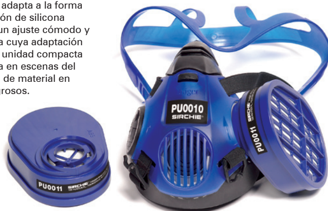
Máscara No. PU0010 con filtros PU0011

Diseñada para aplicaciones que no exigen la protección completa del rostro, esta máscara combina un cierre de silicona sin látex con una protección externa de plástico. La silicona suave se adapta a la forma de cualquier nariz. La combinación de silicona suave y plástico duro garantiza un ajuste cómodo y resistente a filtraciones a un área cuya adaptación es normalmente complicada. La unidad compacta y liviana es excelente para usarla en escenas del crimen en las que hay presencia de material en descomposición y vapores peligrosos.